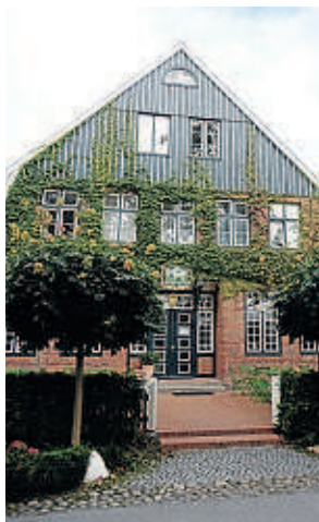
Stilvolle Adresse: das historische Gasthaus „Ole Liese“

Öger Tours bringt den Vorabkatalog für den Sommer 2012 heraus. Ab sofort können die 63 beliebtesten und meistgebuchten Hotels aus dem Türkei- und Ägyptenprogramm gebucht werden. Wer schon jetzt bucht, kann sich somit sein Lieblingshotel an seinem Wunschtermin sichern und zugleich bis zu 25 Prozent im Vergleich zum regulären Katalogpreis sparen. Fast alle Hotels aus dem Vorabkatalog bieten spezielle Familienzimmer, Kinderclubs und attraktive Kinderermäßigungen an. Hinzu kommen All-inclusive-Verpflegung und ein umfangreiches Sportprogramm in nahezu allen Hotels. Die Angebote aus dem Vorabkatalog sind buchbar bis zum 30. September 2011. Infos: www.oeger.de