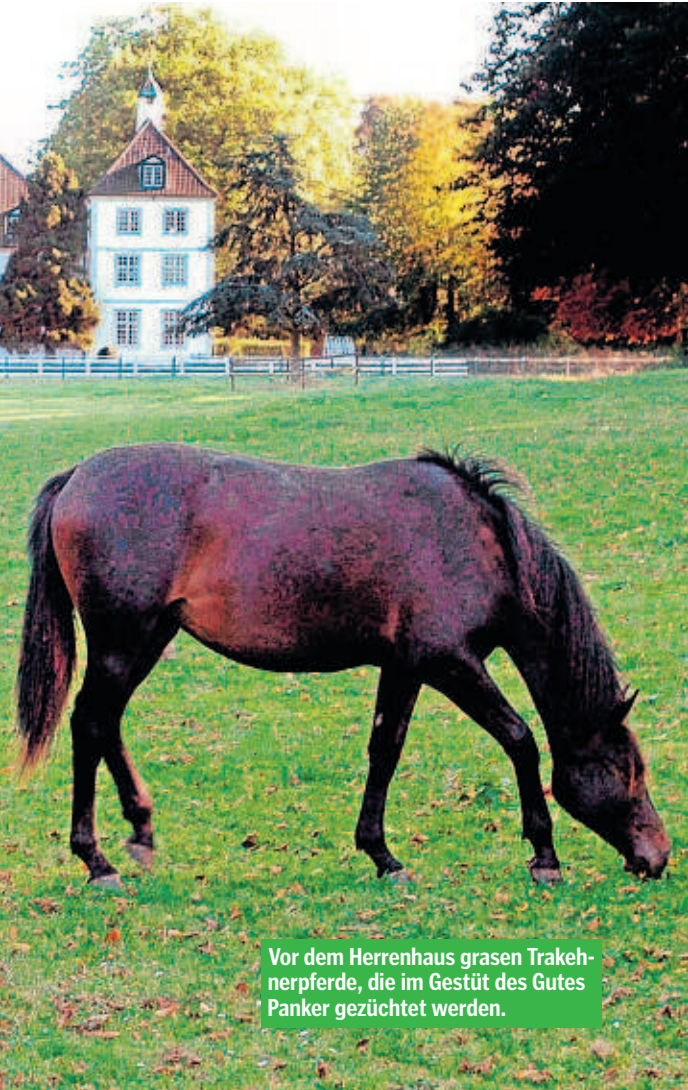
Vor dem Herrenhaus grasen Trakehnerpferde, die im Gestüt des Gutes Panker gezüchtet werden.