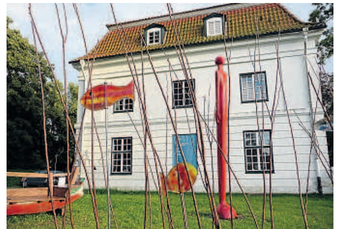
Künstler und Handwerker zeigen ihre Arbeiten im Stilhaus Panker.

tehaus lädt ein kleiner Wellnessbereich mit Sauna unter dem Dach zum Aufwärmen und Entspannen ein. Um das Gut herumverlaufen Wanderwege, die auf den 128 Meter hohen Pilsberg zum Aussichtsturm Hessenstein füh-